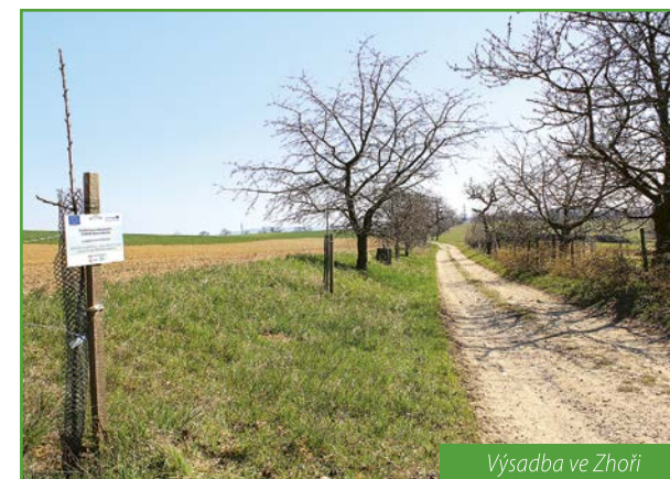
Výsadba ve Zhoři

Pozorní čtenáři předchozích Zpravodajů dávno vědí, že se nejedná jen o Kuničky, které mají co do činění s Klimatickou zelení. Je to i obec Zhoř na Lomnicku, kde se rozhodli pro výsadbu více jak třiceti kusů ovocných stromků, zejména třešní. Výsadba ve Zhoři je rozdělena na dvě části, obě mají určité kouzlo. Místní lidé zkrátka velice dobře vy-