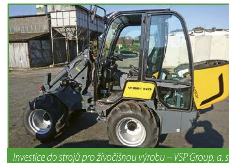
Investice do strojů pro živočišnou výrobu – VSP Group, a.s.