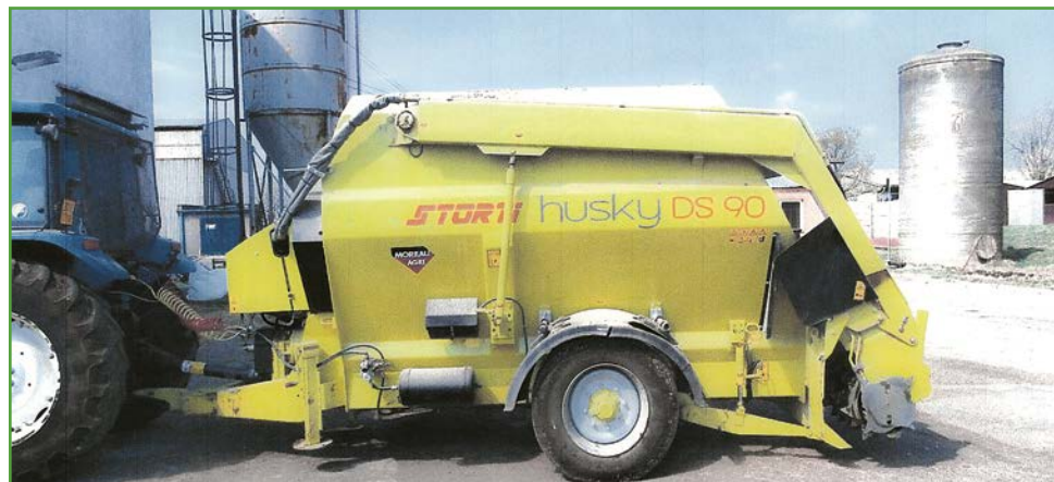
Pořízení krmného vozu – ZD SKÁLY, družstvo