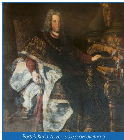
Portrét Karla VI. ze studie proveditelnosti

Věříme, že např. portrét Karla VI. bude po realizaci patřit právě k těm nejhezčím.