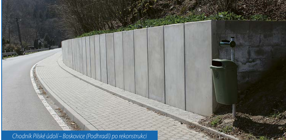
Chodník Pílské údolí – Boskovice (Podhradí) po rekonstrukci

Aktuální stav po rekonstrukci chodníků můžete vidět na fotografii výše. Tento chodník zkrátka nabádá k hezké procházce do Pílského údolí.