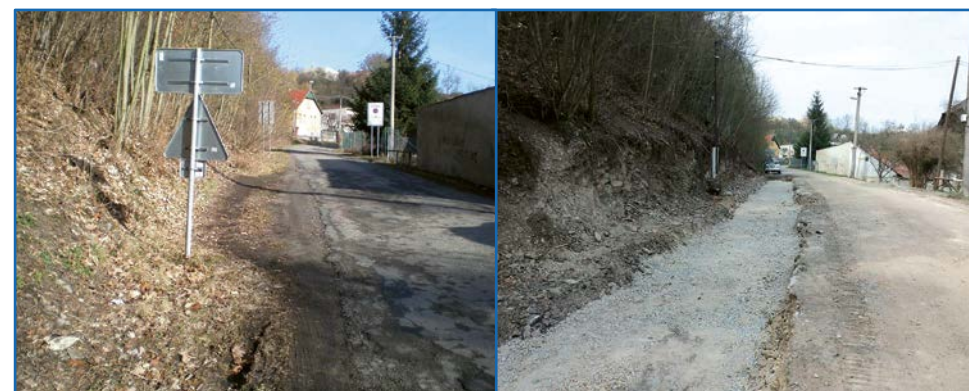
Chodník Pílské údolí – Boskovice (Podhradí) před rekonstrukcí a při rekonstrukci

Níže uvedené fotky vystihují část lokality pro projektový záměr Chodník Pílské údolí – Boskovice (Podhradí). První dvě fotografie poskytl žadatel a zobrazují stav před rekonstrukcí a při ní.