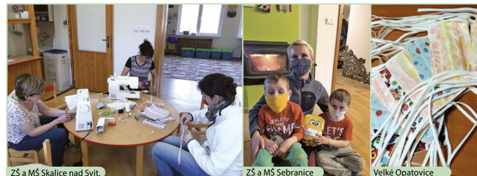
ZŠ a MŠ Skalce nad Svít.

To vše je sice jen zlomek potřebného množství, ale jsme rády, že alespoň svou „troškou do mlýna“ jsme mohly v této nelehké době přispět k zachování toho nejcennějšího, co máme – zdraví!